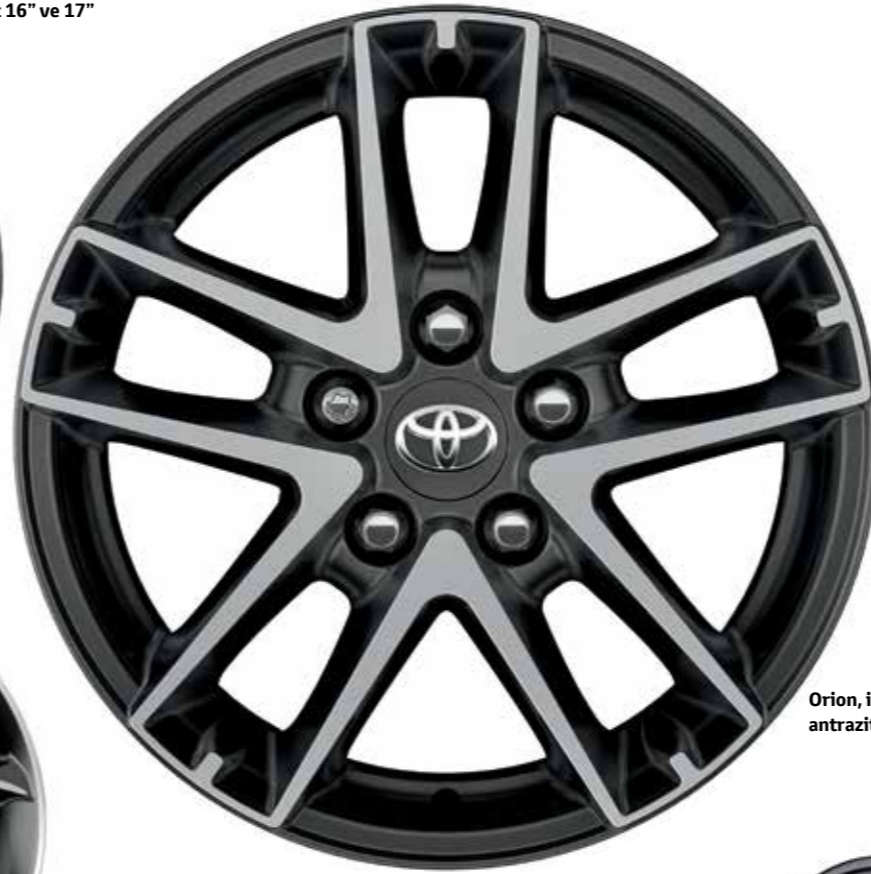
Orion, işlenmiş antrazit 16"