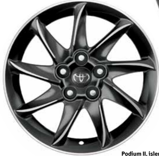
Podium II, işlenmiş antrazit 16" ve 17"