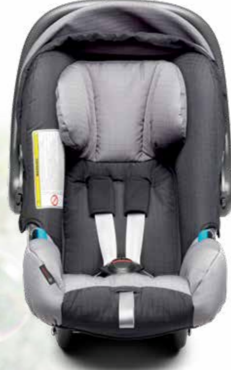
Çocuk koltuğu, Baby-Safe Plus Sıfır - 9 ay arası bebekler için (13 kg'a kadar) konfor ve koruma sağlar.

Bir Toyota çocuk güvenlik koltuğuyla hiçbir şeyi şansa bırakmamış olursunuz. Bağlantı noktaları güvenli, kumaşları dayanıklı, tasarımları ise hem güvenli hem de konforludur. İster yakına, ister uzaklara yolculuk yapın, taşıdığınız en değerli kargonun iyi korunduğuna emin olabilirsiniz.