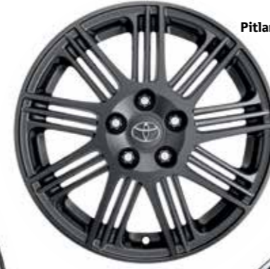
Pitlane II, antrazit 17"