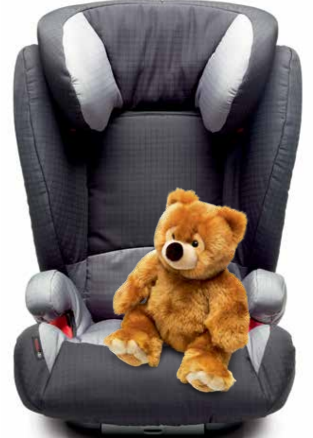
Çocuk koltukları, Kid ve Kidfix 4 - 12 yaş arası (yaklaşık 15 - 36 kg.) çocuklar içindir ve yükseklikleri ayarlanabilir. Kidfix modeli ISOFIX bağlama sistemiyle sabitlenir.