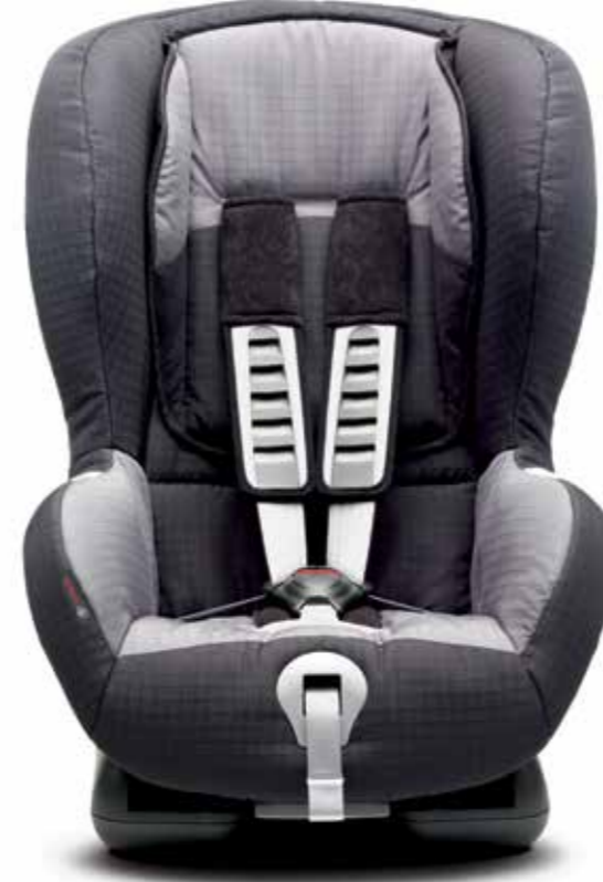
Çocuk koltuğu, Duo Plus 9 ay - 4 yaş arası (yaklaşık 9 - 18 kg) çocuklar içindir. ISOFIX bağlama sistemiyle sabitlenir.